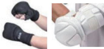
○柔らかいパッドで覆われていても、 指、手、手首、肘や前腕の防具