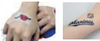
○商業的、宣伝的、チャリティー目的の名前やマーク、 ロゴやその他特定できるもの