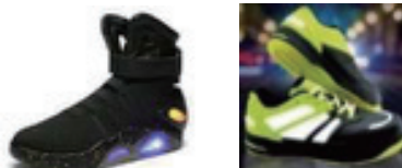
○点滅するライト、反射素材や その他装飾物が付いたシューズ