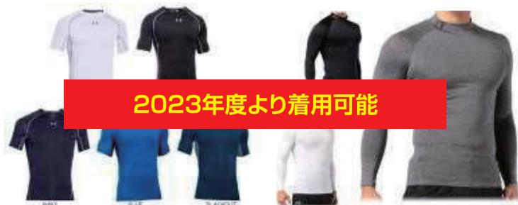
○ユニフォームのシャツからはみ出すシャツ状のもの