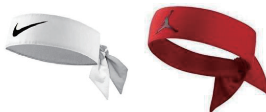
○スカーフスタイルのヘッドバンド